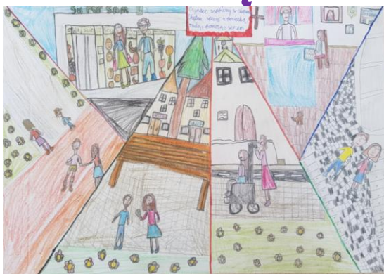
Konkurs plastyczny dla klas 1-4 I miejsce: Maja Łach z klasy 4b