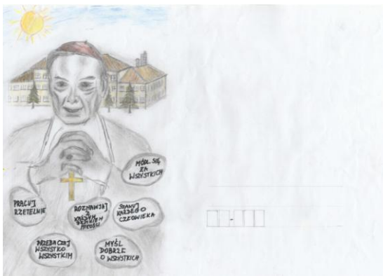
Konkurs plastyczny dla klas 5-8 II miejsce: Julia Sondej z klasy 6g